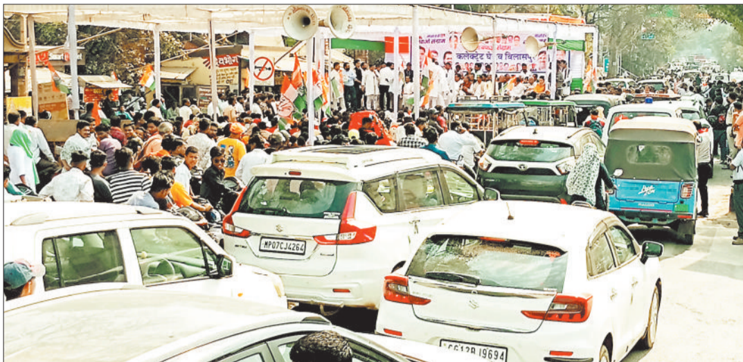
नेहरू चौक पर कांग्रेस के मनरेगा बचाओ आंदोलन के कारण बिलासपुर-रायपुर रोड पर घंटों लगा रहा जाम।

शहर के सबसे व्यस्ततम एवं आवाजाही वाले कलेक्टोरेट क्षेत्र में गुरुवार को पूरे दिन जाम जैसी स्थिति रही। कांग्रेस के मनरेगा बचाओ आंदोलन के मद्देनजर जिला एवं पुलिस प्रशासन द्वारा एक दिन पहले से ही ठोस तैयारी कर ली गई थी। इसके अंतर्गत नेहरू चौक के पास