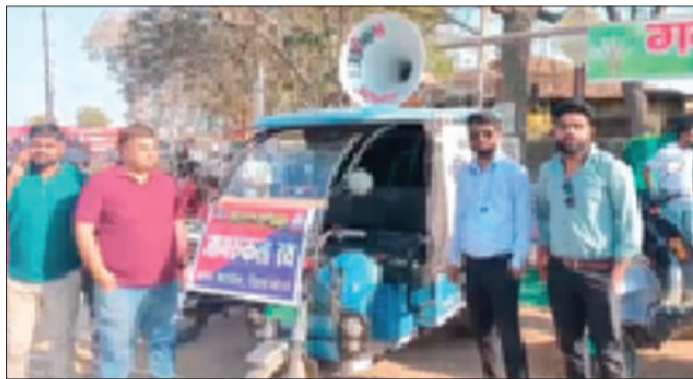
अभियान के दौरान उपस्थित विभाग के कर्मचारियों।